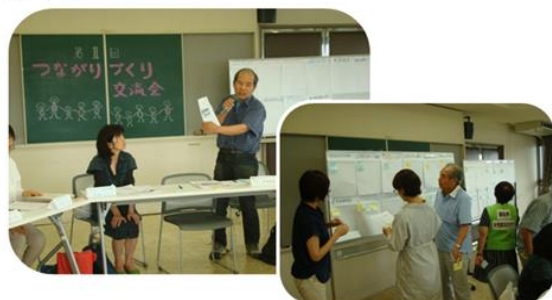
第1回の様子(平成30年7月7日) 自分たちの活動紹介・ワーク“それいいね!!”