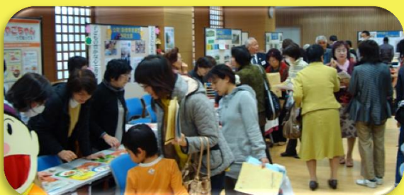
たくさんの方で賑わった交流会