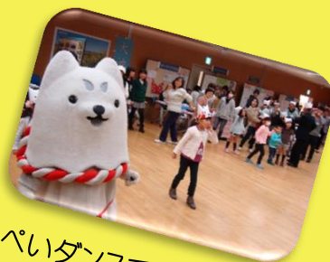
しっぺいダンスで会場がひとつに!! 心も一つに!!