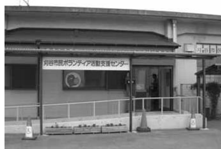
刈谷市民ボランティア活動支援センター

利用者・相談・見学など総来館者は、今年5月で1万人を超え、登録は200団体に迫る勢いです。これからも市民活動の協働は勿論のこと、