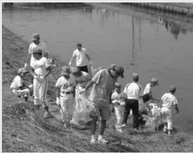
その空き缶とれるかな