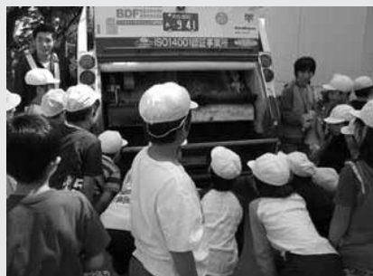
パッカー車にごみが入ってく~