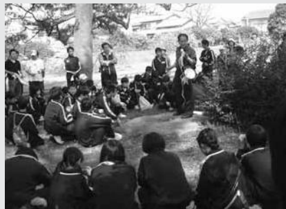
七重の塔が建っていたんだよ