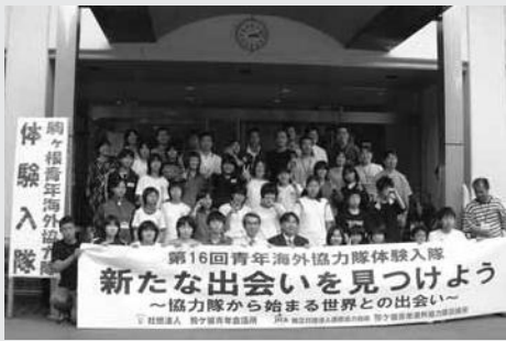
来年も参加してね～

この事業は駒ヶ根青年会議所が同訓練所と協力して、地元中学生を、まもなく任期である発展途上国へ旅立とうとする訓練生（以下候補生）とふれあひながら国際協力・異文化との交流を体験してもらおうというものです。磐田市からも約10年前から参加しています。