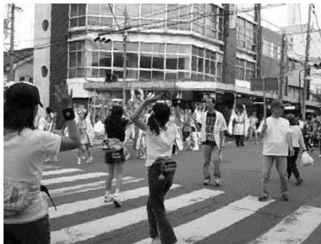
まちサポ活動中 大祭り

この制度は、平成14年1月にスタートした磐田独自の制度です。平成17年4月1日現在の会員数は124名。市外の方も登録しています。