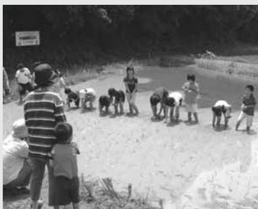
一列にしっかり植えてね~