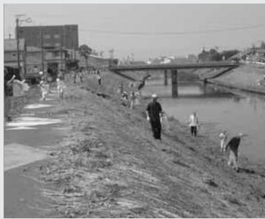
いつもきれいな川でいてね