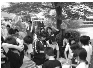
姉妹都市だって新しい仲間

合併前の昨年、「まちづくりネットワーク」を市内全戸配布させていただきました。NPO・市民活動の推進という堅苦しいテーマで4年間発信してきました。もっと気楽に、楽しんで活動している皆さんを紹介する1年ではないかと考えています。みんな新しい磐田市の仲間です。取材申込歓迎します。(村上)