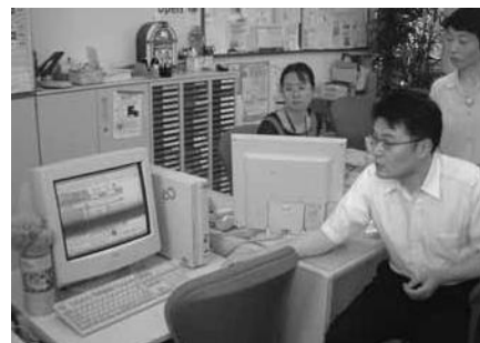
「元気365情報サイト」が特長です

スタッフの自己成長と情報紙「ぼらっち」で一層のPR活動をし、さらなる利用者の拡大を目指しています。