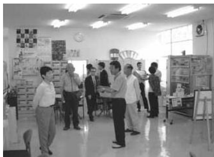
センター内部 磐田に生かせるものは？

スタッフの自己成長と情報紙「ぼらっち」で一層のPR活動をし、さらなる利用者の拡大を目指しています。