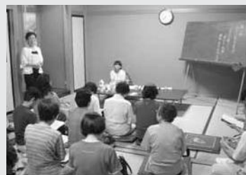
しっかり学習いたしましょう