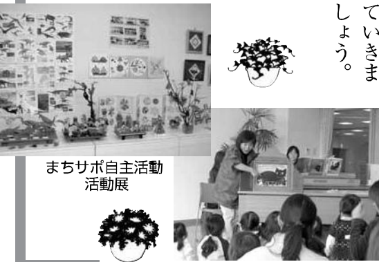
まちサポ自主活動活動展