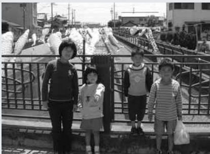
元気に育て子どもたち