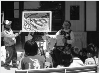
紙しばい “いなばの白うさぎ”

4月23日(土)24日(日)見付 本通りにおいて、見付宿 を考える会主催の「見付 宿楽しい文化展」が行わ れました。中川にはこい のぼりが泳ぎ、通りのあち こちで自慢のお宝や演奏 会・紙しばいなどが催さ れました。ゆつくりと歩 きながらまちの楽しさを 味わえるイベントでした。