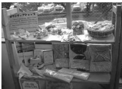
ボランティアショップ

くり関連図書の本棚、ボランティアショップで3階は会議室になっています。市役所に近接し、明るい部屋と午後11時までの開館は利用者にとって活動しやすいのではないかと感じました。