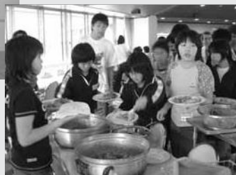
みんなでつくったパキスタン料理味はどうか？