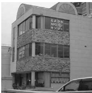
とよかわNPOセンター「ほっと」