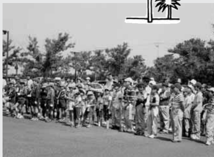
たくさんの人が参加