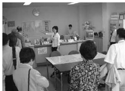
センター内部 とっても明るい