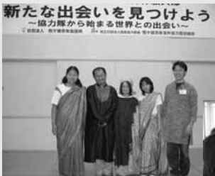
世界の民族衣装でハイポーズ！