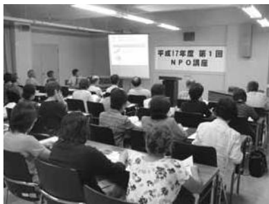
豊岡地区・NPO入門講座

平成17年8月27日、市民団体 関係者37名、市関係者5名が参 加し、豊岡支所会議室で行われ ました。協議会からの講師が 「NPOとは」についてわかり やすく解説しました。「NPO に参加し活動しているが、その 活動が広がっているように感じ ない」など意見が出されました。 講座後、NPOに関する「相談 窓口」を各支所に設けてはどうか という提案があり、市と協議 会で検討し来年度の取り組み課 題として計画中です。