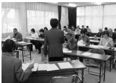
竜洋地区・NPO入門講座

平成18年2月24日、市民団体 関係者20名、市関係者5名の参 加で竜洋老人福祉センターで行 われました。事前の打ち合わせ の中で、いま一度NPOに対す る理解を深めたいという要望か ら入門講座として開催しました。 「活動の後継者がみつからない」 との意見が寄せられ、「活動を 継続する中で、広く窓口をあけ 多くの方と交流を持つことにし ている」と助言がありました。