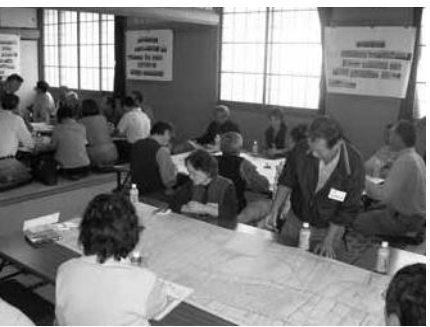
地図を広げてワークショップ