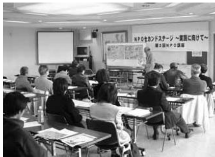
豊田地区・NPO入門講座

加。豊田支所大会議室において 「NPO活動における問題解決 をめざす講座」と位置付けて行 われました。「NPO法人ふく でハッピーハンズ」「NPO法人 桶ヶ谷沼を考える会」「しずおか ケナフの会」の各団体から実践 発表がありました。その後活動 に対しての質問を参加者からい ただき、意見交換をしました。 桶ヶ谷沼を考える会へは、全国 とんぼサミットの運営の様子や とんぼ生息の現状。ハッピーハ ンズへは、活動スタッフや資金 調達の方法。ケナフの会へは、 浜名湖ガーデンパークでの活動 についてなどが質問されました。 お互いに顔を合わせ、話し合い が出来たことに意義があったと 感じます。こうした「交流の場」 を多く持ちながら今後の住みよ いまちづくり、NPO活動の推 進につなげたいと思います。