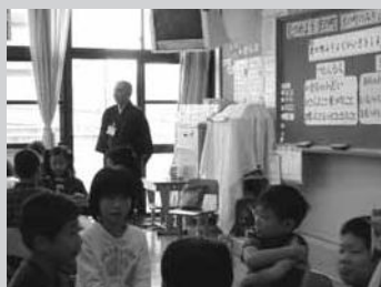
今日はお坊さんが先生