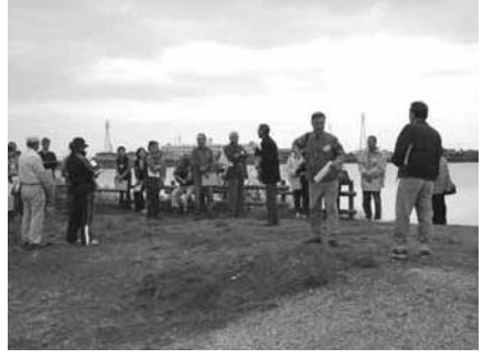
大池周辺ウォーク

磐田駅南口より南へ徒歩約20分。市街地のはずれに大池があります。市民のみならず市外から訪れる方々が、自然とのふれあいができる憩いのスペースとなるよう公園化整備を願うワークショップが昨年10月末よりスタートしています。