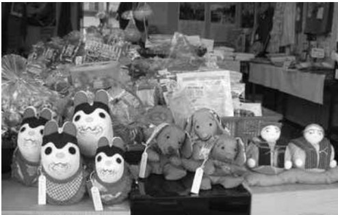
手作り品・磐田の品物など満載です

コンテストで銅賞に輝いた「いわたのお茶」、円空式一刀彫、手拭きタオルグッズなど多くの商品が並び予想以上にお客が足を運んでくれるとのこと。高齢者に優しい店として縁台が置いてあるのも、うれしい配慮と感じました。