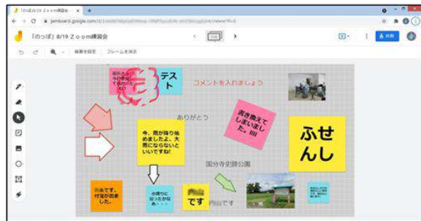
Google Jamboardを使ってみました