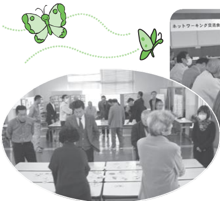
環境カルタで和気あいあい