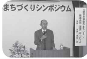
コーディネーターは抜群!

委員会における議論は、これまでに他市のさまざまな会議の中でも高いレベルの内容であったことや、まちづくりをさらに進めるために市民・NPO・企業・行政が連携していくために「信頼・誘引・翻訳」のキーワードが出されました。