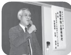
セカンドライブを 笑みあるものへ (平成18年12月9日)