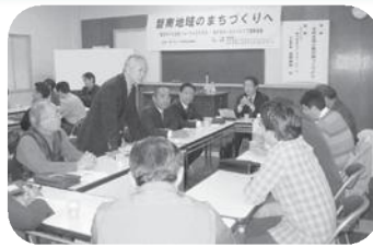
交流フォーラム2003 (平成15年10月18日)