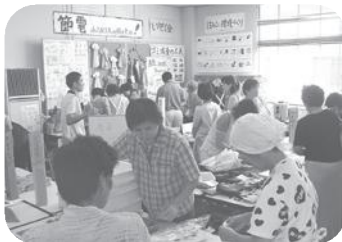
パンとクッキーの即売 (平成17年9月19日)