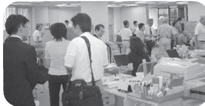
藤沢市市民活動推進センター (平成16年7月12日)