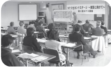
NPO入門講座・磐田地区 (平成17年8月27日)