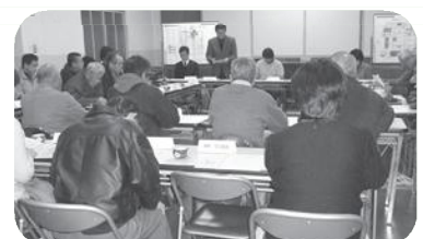
利用者意見交換会「移転について」 (平成21年1月17日)