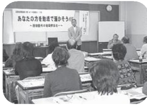
当社の社会貢献活動は… (平成18年11月9日)