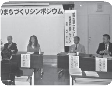
それぞれの立場で それぞれができることは...

条例では、市民・NPO・企業・行政それぞれの役割や相互の関係を明らかにするとともに、具体的な市の施策や「協働のまちづくり推進委員会」の設置等をうたっています。この条例が「協働」への共通認識となり、まちづくりを担う全ての人々が一体となった「協働のまちづくり」の推進が期待できるものと考えます。 市民のやってみようという想いを形にするため、事業計画を作成するお手伝いや市民・企業へ参加者への募集・広報など、当協議会ではこれまで以上に応援してまいります。