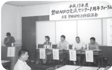
これからのまちづくりにむけて… (平成19年9月16日)