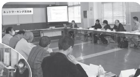
知恵をしぼってアイディアは...

このように市民活動をする人が集い、語り合えるNPOセンターであることが、協働の拠点として目指す姿の一つです。