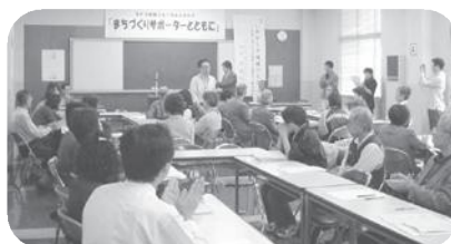
交流フォーラム2002 (平成14年10月20日)