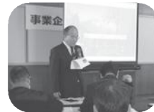
熱のこもった発表!