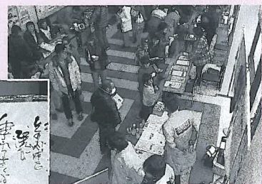
動けば変わる見本市(ちーむあい)