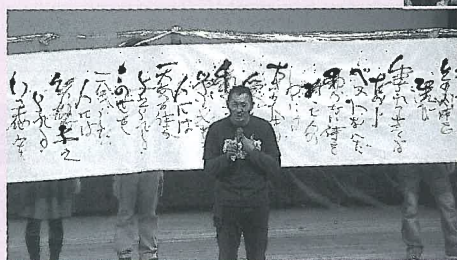
てんつくマンによる巨大書き下ろしパフォーマンス