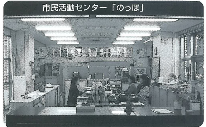
市民活動センター「のっぽ」